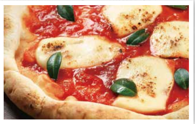
ピッツァ・マルゲリータ ¥1,550 Margherita Pizza / 玛格丽特披萨