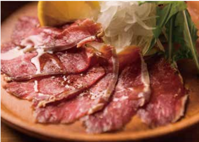
蝦夷鹿の生ハム ¥ 1,880 Ezoshikia (Hokkaido deer) venison Prosciutto 虾夷鹿生火腿