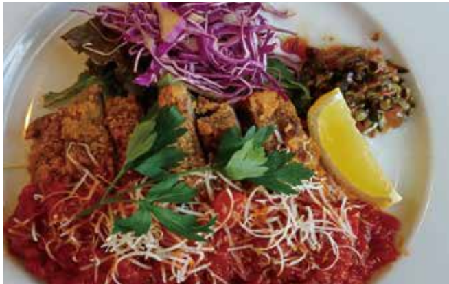
北海道牛フィレの ミラノ風カツレッツ