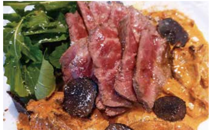
北海道牛フィレのタリアータ ¥ 4,980 トリュフとポルチーニソース

Hokkaido Fillet Steak with Truffle and Porcini Sauce (Tagliata)