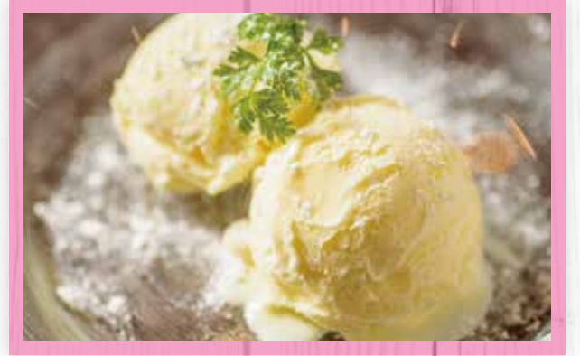
北海道ミルクアイスクリーム ¥600 Hokkaido Milk Ice Cream / 北海道牛奶冰淇淋