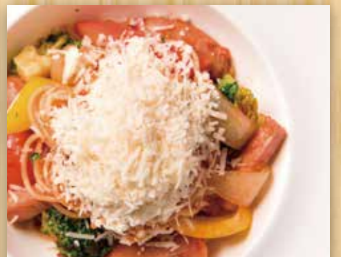
農家ベーコンと 粗挽きソーセージのナポリタン

Bacon and Pork Sausage Napolitan 猪肉香肠培根茄汁意大利面