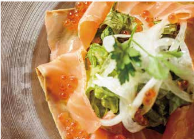
とろサーモンとイクラのカルパッチョ ¥1,380 Fatty Salmon and Salmon Roe Carpaccio 三文鱼和鲑鱼籽的卡帕奇欧