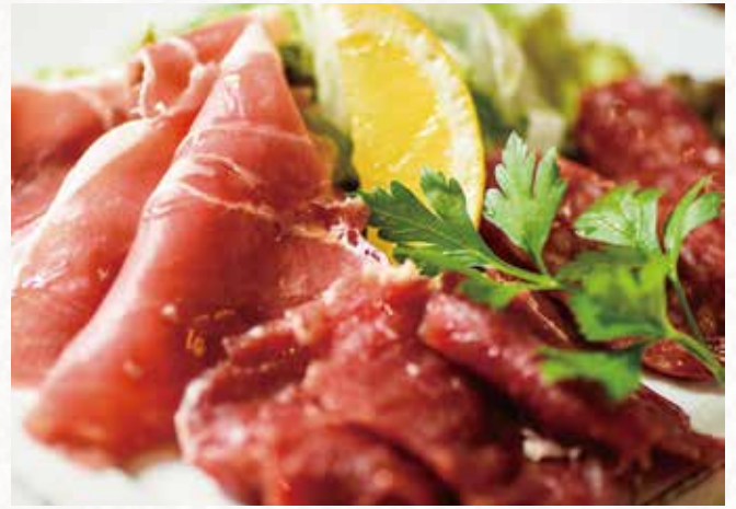
生ハムとサラミの盛り合わせ ¥ 2,780 Assorted Jamon Serrano, Venison prosciutto and Salami 生火腿, 鹿生火腿意式腊肠拼盘