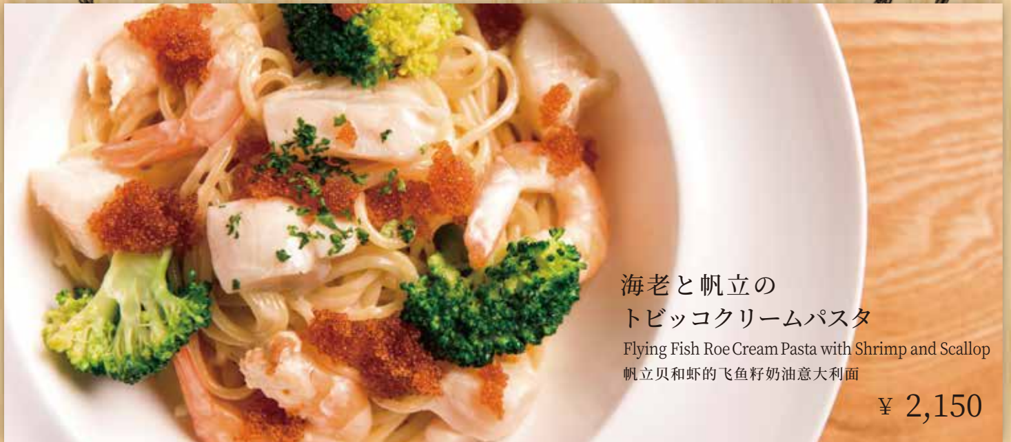
海老と帆立の トビッコクリームパスタ

Flying Fish Roe Cream Pasta with Shrimp and Scallop 帆立貝和虾的飞鱼籽奶油意大利面