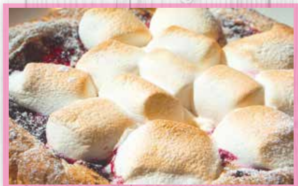
マシュマロとハスカップジャムの デザートピッツァ ¥2,080 Marshmallow and Haskap Jam Dessert Pizza / 棉花糖和哈斯卡普果酱甜点比萨