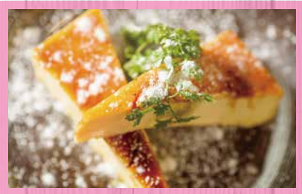
花畑牧場のカタラーナ ¥780 Crema Catalana from Hanabatake Farm 花畑牧场的焦糖奶冻