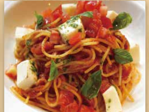
日高モッツァレラ・トマト・バジルの パスタポモドーロ

Hidaka Mozzarella Cheese, Tomato, Basil and Tomato Sauce 日高马苏里拉奶酪番茄罗勒意大利面