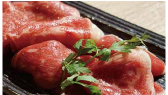
十勝和牛サーロイン