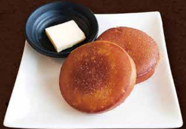
いももち ¥880 Potato mochi 馬鈴薯糰餅