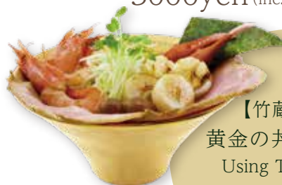
67 北海道スペシャルらーめん 味噌 miso / 醤油 soy sauce / 塩 salt HOKKAIDO SPECIAL ramen 北海道特制拉面 3000yen (inc. tax)

【竹藏特製】 黄金の井ぶり使用 Using TAKEZO's original golden bowl