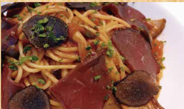
トリュフとポルチーニ