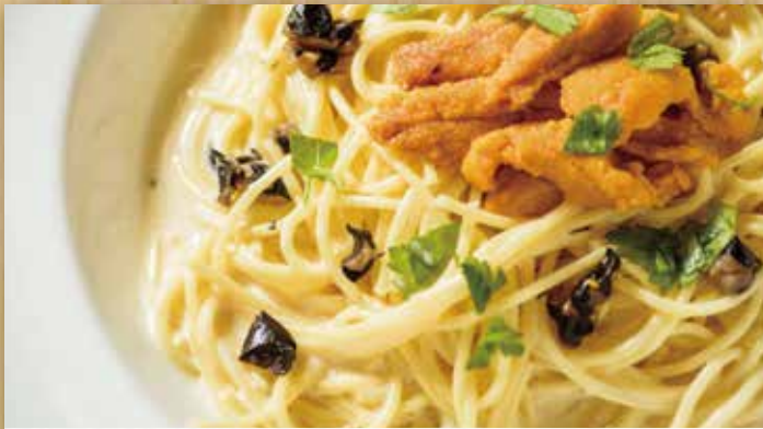
黒トリュフと雲丹チーズソースのパスタ

海の幸や山の幸を贅沢につかって味わい深く。 Cooked with the bounties of land and sea.