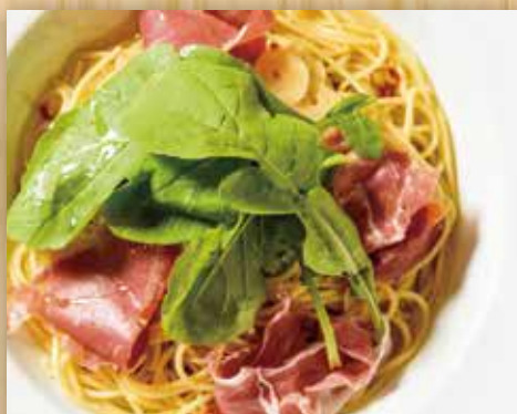
スペイン産生ハムとルッコラの ペペロンチーニ

Jamon Serrano and Arugula Pepperoncini 生火腿芝麻菜香辣意大利面