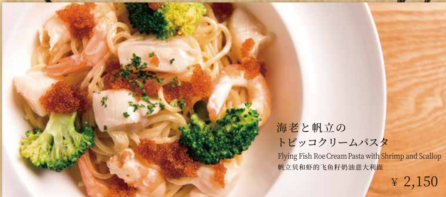
海老と帆立の トビッコクリームパスタ

Flying Fish Roe Cream Pasta with Shrimp and Scallop 帆立貝和虾的飞鱼籽奶油意大利面