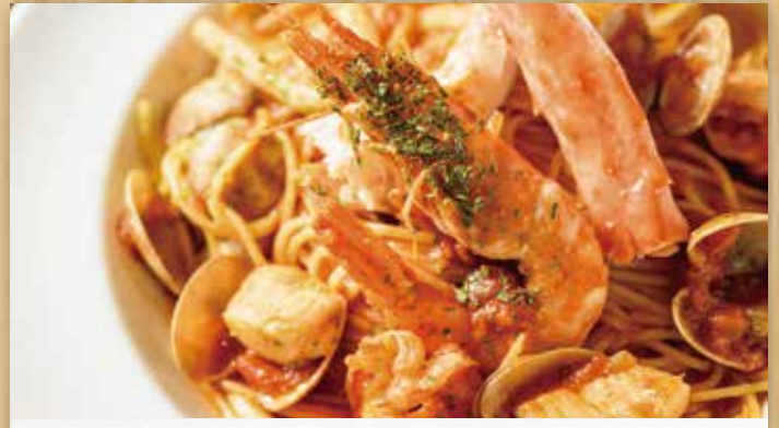
タラバ蟹と海老の