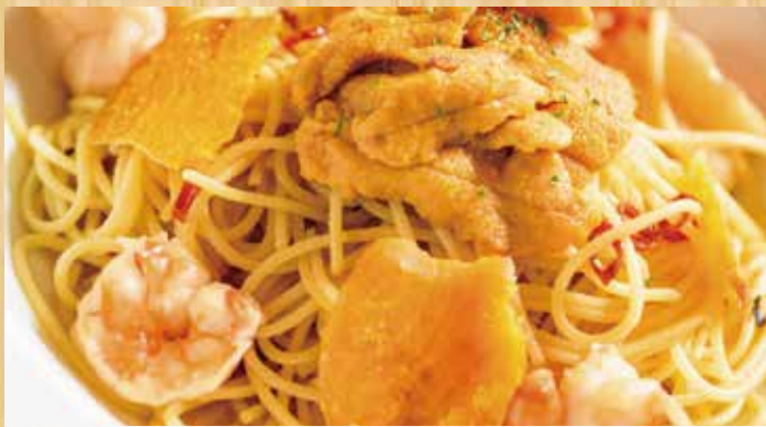
雲丹と海老・からすみのペペロンチーニ

Urchin, Shrimp and Dried Mullet Roe Pepperoncini 海胆和虾・乌鱼籽的香辣意大利面