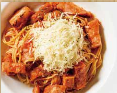
農家ベーコンと エキストラチーズのアマトリチャーナ

Bacon with Extra Cheese Amatriciana Sauce 芝士阿马特里奇亚纳酱猪肉培根意大利面