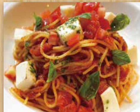
日高モッツァレラ・トマト・バジルの パスタポモドーロ

Hidaka Mozzarella Cheese, Tomato, Basil and Tomato Sauce 日高马苏里拉奶酪番茄罗勒意大利面