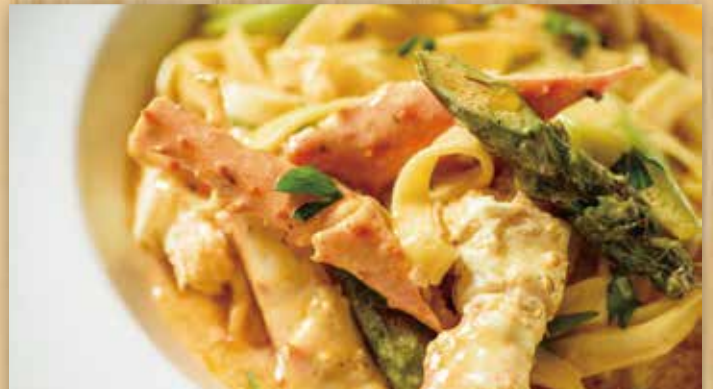
タラバ蟹とアスパラガスの