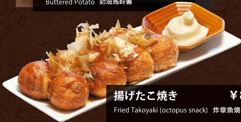
揚げたこ焼き ¥890 Fried Takoyaki (octopus snack) 炸章魚燒