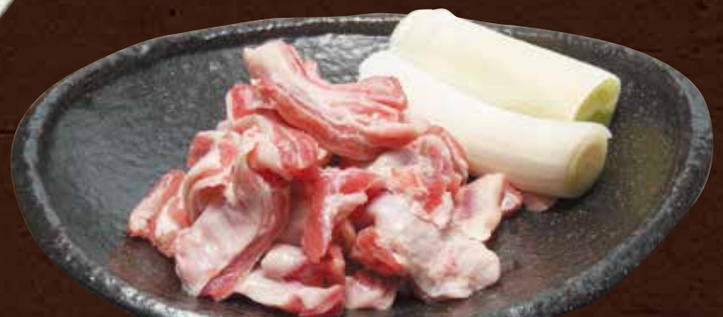
ラムリーブフィンガー ¥2,390