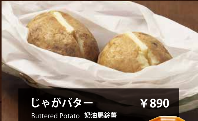
じゃがバター ¥890 Buttered Potato 奶油馬鈴薯