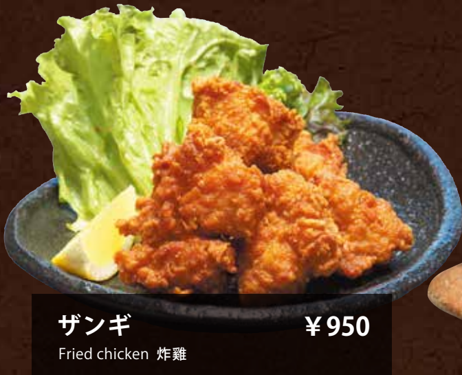
ザンギ ¥950 Fried chicken 炸雞