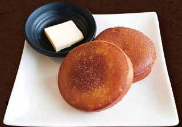
いももち ¥790 Potato mochi 馬鈴薯糰餅