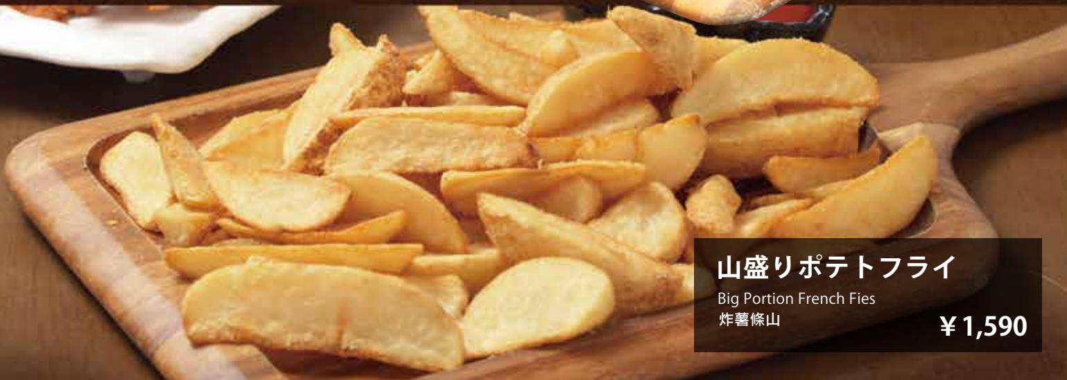
山盛りポテトフライ ¥1,590 Big Portion French Fries 炸薯條山