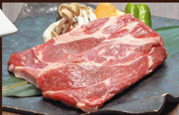
特上ラムステーキ 160g ¥6,000