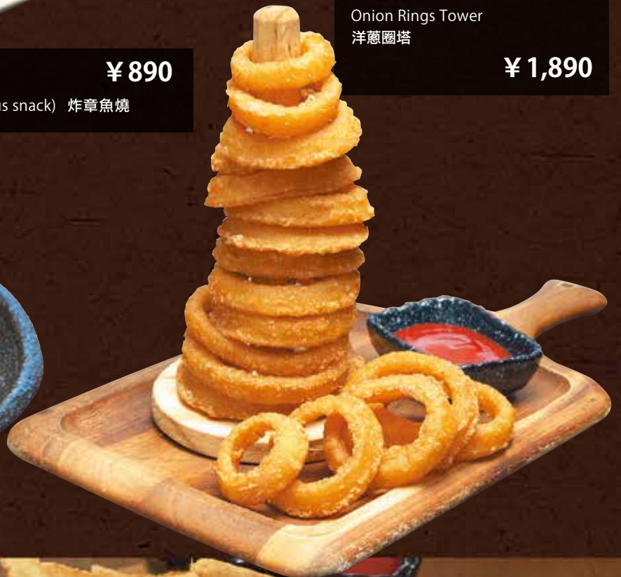
オニオンリングタワー ¥1,890 Onion Rings Tower 洋蔥圈塔