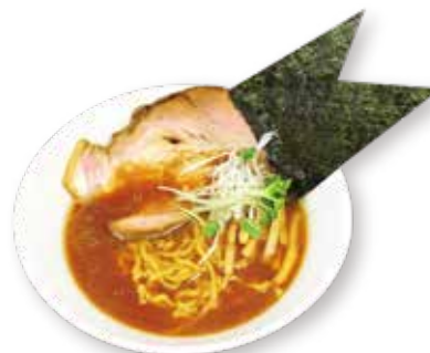
66 初代醤油らーめん Soy sauce ramen 竹藏酱油拉面 1500yen (inc. tax)