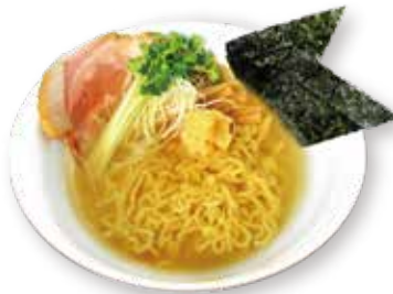
65 塩生姜らーめん Salt ginger ramen 姜汁盐味拉面 1500yen (inc. tax)