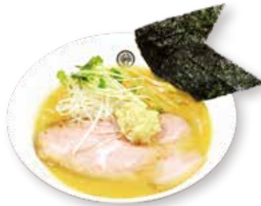
61 味噌生姜らーめん Miso ginger ramen 生姜味噌拉面 1600yen (inc. tax)