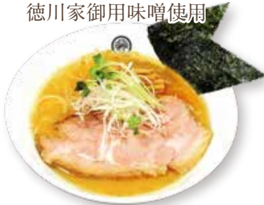
60 徳川味噌らーめん Miso ramen 味噌拉面 1600yen (inc. tax)