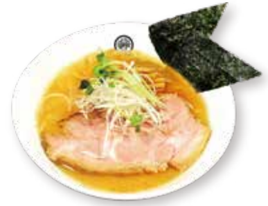
62 焦がしニンニク味噌らーめん Burned garlic miso ramen 烧焦大蒜味噌拉面 1600yen (inc. tax)