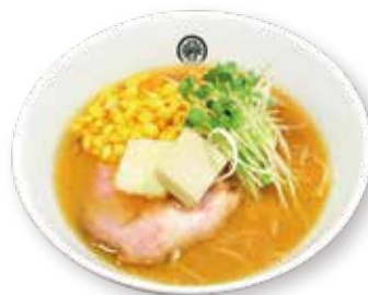
64 コーンバター味噌らーめん Corn butter miso ramen 奶油玉米味噌拉面 1600yen (inc. tax)