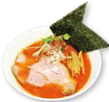
63 辛味噌らーめん Spicy miso ramen 辣味噌拉面 1600yen (inc. tax)